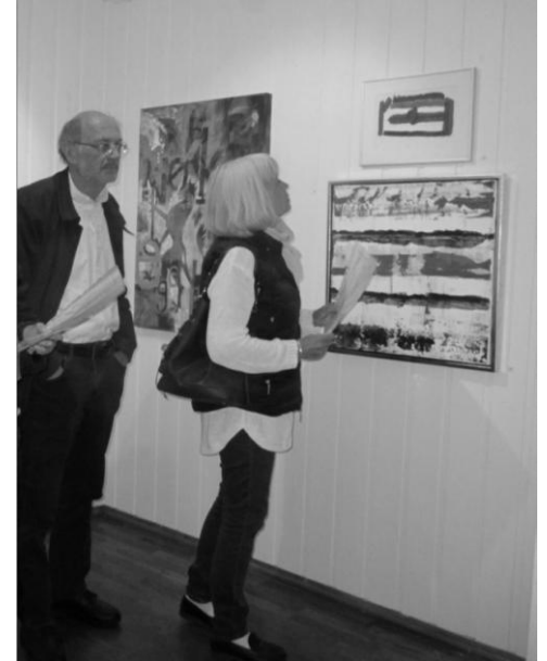
Høstutstillingen 2014 «GRUNNLOVEN 1814»