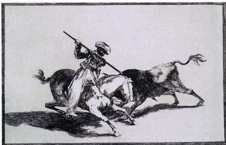
FRANCISCO DE GOYA «TAUROMACHIA 3»

Grafisk kunst, av gresk grafein, å skrive, men som regel mener man med et grafisk blad, et avtrykk av en trykkplate som kunstneren, grafikeren, på forhånd har utformet. Av hver plate kan det tas flere trykk, og hvert trykk betraktes som et originalt kunstverk. Man skjeler mellom tre former for grafikk: Høytrykk, som omfatter tresnitt, xylografi (også et slags tresnitt), linoleumssnitt og visse former for metalltrykk; her ligger de fargede partiene av trykkplaten høyere enn de ufargede. Plantrykk eller litografi og serigrafi, der de fargede og de ufargede ligger i samme plan. Dyptrykk-intaglio omfatter kobberstikk og radering; her ligger de fargede partier nedsenket i platen.