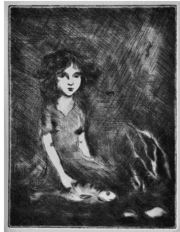
"Under vann", koldnål, Elisabeth Høyer