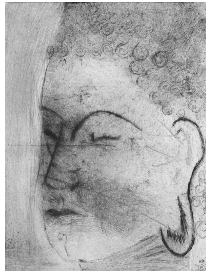
”Stillhet”, dyptrykk, Ann-Christin Lykke Fredriksen