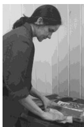
Slår av sverte