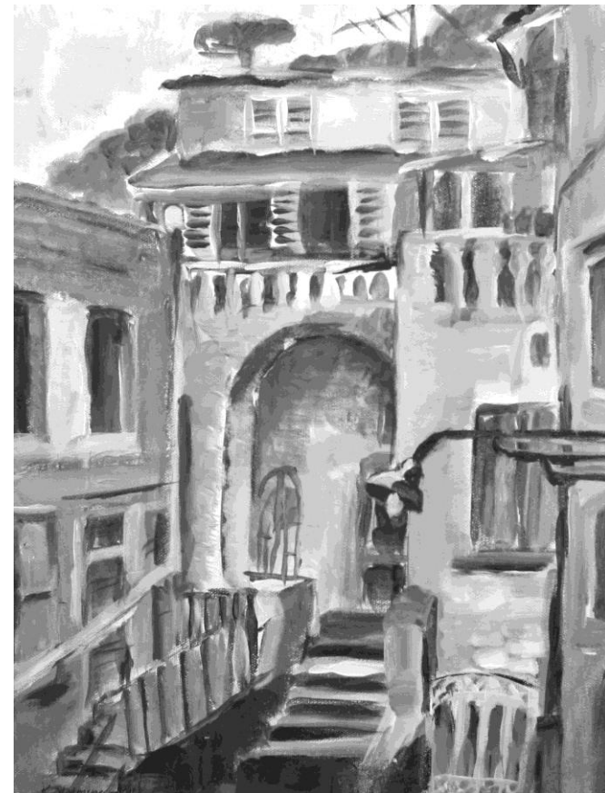
"Italia - hus med sjel", 35x25 cm ,akryl , Kirsten Strømsnes