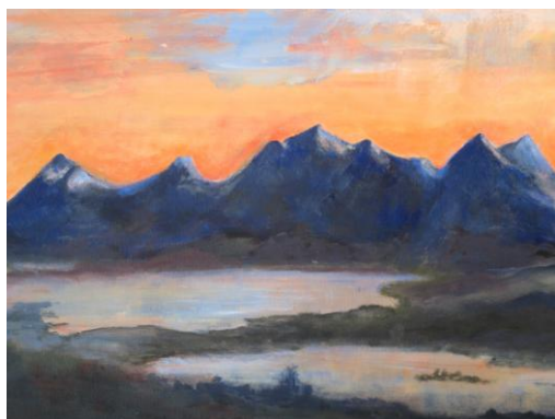
Ett lite sommerminne fra vakre Hamarøy. Malt av Eva Rønning.

Styret takker medlemmene for et hyggelig og aktivt år.